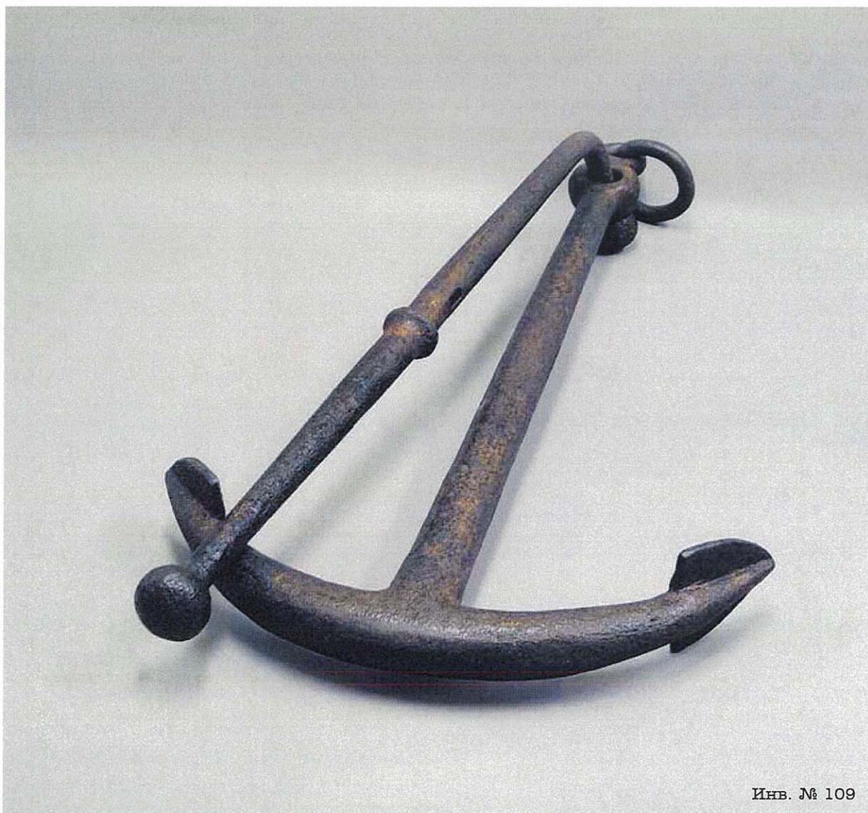
Инв. № 109