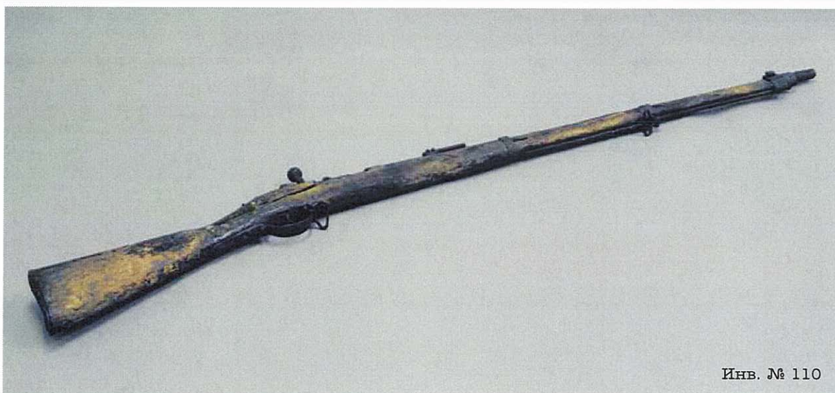
Инв. № 110