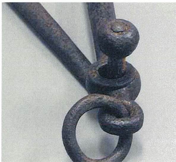
Инв. № 109. Деталь