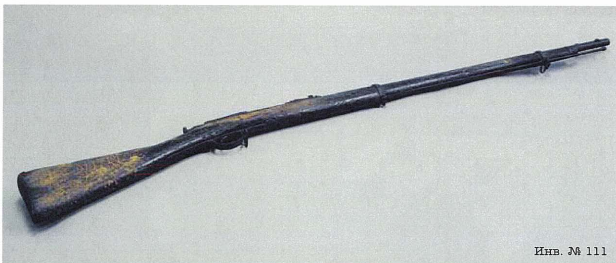
Инв. № 111